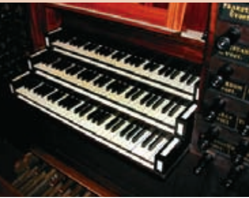
AFBEELDING 5 De klavieren van het Timpe-orgel (1830) in de Nieuwe Kerk te Groningen. De drie handklavieren hebben ondertoetsen met ivoorbeleg en boventoetsen van ebbenhout. Rechts is een deel van de registerknoppen te zien