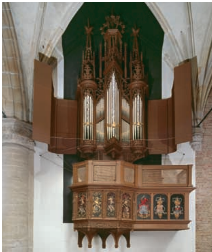
AFBEELDING 3 Het koororgel van de Grote Kerk van Alkmaar (1511)

Het was echter op vijftiende-eeuwse orgels nog niet mogelijk om uit verschillende soorten klanken, registers, te kiezen. Maar in de zestiende eeuw ontwikkelden orgelmakers twee systemen om dat wel te kunnen en die registers naar eigen inzicht te combineren. In die tijd ontstonden ook orgelregisters die andere instrumenten imiteren, zoals fluit, gemshoorn en trompet. De Nederlandse orgelmakers waren in de zestiende eeuw de meest moderne en toonaangevende in Europa. Van een van hen, Jan van Covelens, is een klein orgel bewaard gebleven in de Grote Kerk van Alkmaar, het koororgel uit 1511 (ZIE AFBEELDING 3). Zijn opvolger Hendrik Niehoff bouwde behalve in Nederland ook in Noord-Duitsland enkele orgels, die daar een inspiratiebron bleken voor de plaatselijke orgelmakers.