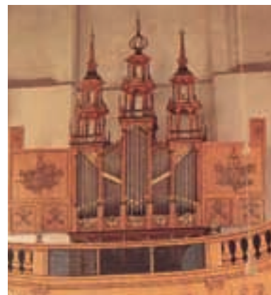
AFBEELDING 11 Het orgel van de Hervormde Kerk van Oosthuizen werd altijd gedateerd op 1521. Bij recent onderzoek is echter gebleken dat het instrument omstreeks 1680 werd samengesteld uit oudere onderdelen. Het orgel is gestemd in middentoonstemming