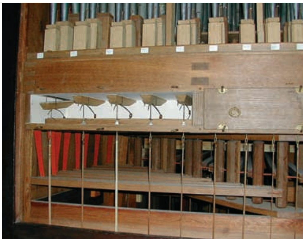
AFBEELDING 10 Een geopende ventielkast. Normaal is de ventielkast afgesloten met een voorslag, zoals rechts naast het geopende deel te zien is. De ventielen bevinden zich, naast elkaar, bovenin de ventielkast, tegen de onderzijde van het cancelraam. Het linkerventiel is geopend. Onder de ventielkast zijn de dumme abstracten te zien waarmee toetsen en ventielen aan elkaar verbonden zijn

Restauratiewerkzaamheden die noodzakelijk zijn voor herstel of conservering zijn subsidiabel in het kader van het Besluit rijkssubsidiëring restauratie monumenten 1997 (Brrm 1997). Uitgangspunt bij iedere restauratie is voor de Rijksdienst voor de Monumentenzorg het conserveren van de bestaande, historisch gegroeide situatie. Soms is dit bij orgels maar ten