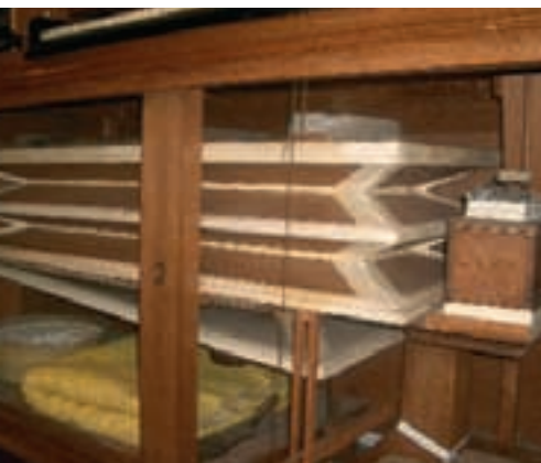
AFBEELDING 9 Een balg in geopende toestand. De vouwen van de balg zijn met leer aan elkaar verbonden. Onder de rechthoekige balg bevindt zich een schuine schepbalg, waarmee de bovenliggende balg gevuld wordt. Rechts naast de balg is een deel van het windkanaal te zien, waarmee de wind naar de windlade getransporteerd wordt

bijgestemd. Stemmen kan eenvoudig leiden tot schade aan de pijpen. Daarom is het beter het orgel hoogstens eenmaal in de drie tot vijf jaar een generale stembeurt te geven. Over het algemeen is dit ook niet vaker nodig.