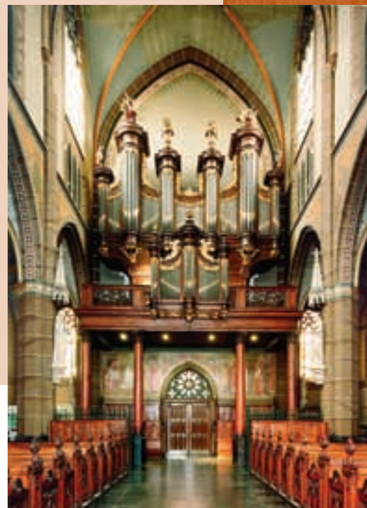
AFBEELDING 1 De ontwerpers van de zuidelijke orgels streefden eerder naar een grote breedte-werking in het frontontwerp dan naar grote hoogte, zoals bijvoorbeeld bij het Bavo-orgel (zie afbeelding 8). Het uit Averbode afkomstige orgel van de St.-Lambertuskerk te Helmond (1772) is hiervan een goed voorbeeld

In de afgelopen vijftig jaar is er veel kennis opgedaan bij het restaureren van kerkorgels en is er door toedoen van de Rijksdienst voor de Monumentenzorg veel onderzoek gedaan. De goede samenwerking tussen orgelmakers, orgeladviseurs en Monumentenzorg heeft bijgedragen tot het hoge niveau waarop in Nederland wordt gerestaureerd.