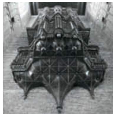
AFBEELDING 7 Het Hagerbeer-orgel in de Pieterskerk te Leiden (1645), van onderaf gefotografeerd. Hagerbeer maakte gebruik van een onder rugwerk, waarvan op deze foto het fraaie soffiet, dus het ondervlak, goed te zien is