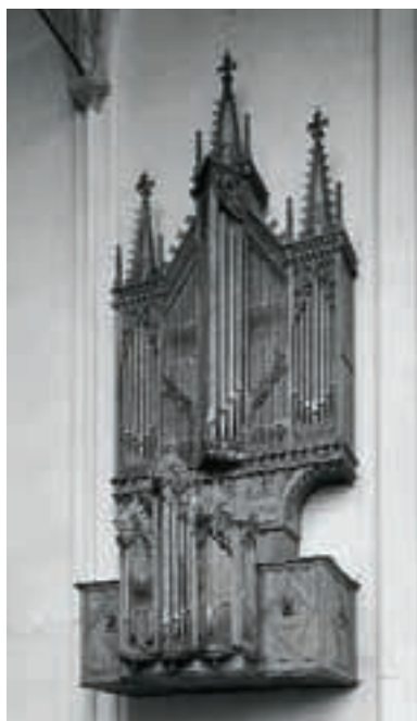
AFBEELDING 2 Het orgel van de Nicolaïkerk te Utrecht (1479) werd in 1886 gedemonteerd en opgeslagen in het Rijksmuseum. Sinds 1956 hangt de orgelkas in de Koorkerk van Middelburg. Het binnenwerk wordt in afwachting van een restauratie elders bewaard

De houten omtimmering, oftewel de orgelkas, van een van de oudste nog bestaande orgels ter wereld bevindt zich in de Koorkerk te Middelburg. Het zeer waardevolle binnenwerk van dit instrument wordt op een andere plaats bewaard. Het werd oorspronkelijk gebouwd voor de Nicolaïkerk in Utrecht door Peter Gerritsz in 1479 (ZIE AFBEELDING 2). Dit zeer oude orgel markeert het begin van de lange Nederlandse orgelhistorie.